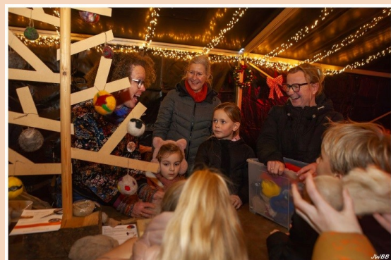
Workshop kerstballen viltten met Mooimiek